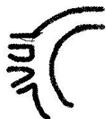
Schemat łuku aorty.

Uwidoczniło łuk aorty Nie uwidoczniło łuku aorty