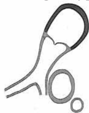
Schemat drogi wypływu z prawej komory serca.

Naczynie wychodzące z prawej komory: rozgałęzia się nie rozgałęzia się nie uwidoczniło