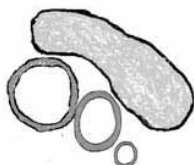
Schemat śródpiersia górnego.

3 naczynia: widoczne niewidoczne Szerokość naczyń: prawidłowa nieprawidłowa Grasica: widoczna niewidoczna