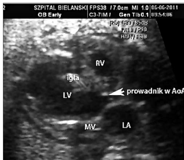
Rycina 3. Prowadnik wprowadzony przez uprzednio włożoną igłę w odpowiedniej pozycji powyżej zastawki aortalnej. Strzałka pokazuje prowadnik między płatkami zastawki aortalnej, AoA – aorta wstępująca, LV – lewa komora, RV – prawa komora, MV – zastawka dwudzielna.

Biometria była prawidłowa, szacowana masa płodu z obrzękiem około 1650g. Pacjentka otrzymywała leki tokolityczne z powodu przedwczesnej czynności skurczowej i skracania się szyki macicy. W badaniu echokardiograficznym płodu rozpoznano krytyczne zwężenie zastawki aortalnej, ze znacznie powiększoną lewą komorą o upośledzonej funkcji skurczowej (%SF <9%) i rozkurczowej (monofazowy napływ do lewej komory przez zastawkę dwudzielną). (Rycina 1 C).